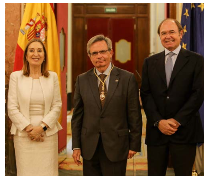
Matesanz, entre Ana Pastor, presidenta de la Cámara Baja, y Pio García Escudero, presidente del Senado, con la Medalla del Congreso de los Diputados en el 40 aniversario de la Constitución

La ONT no es una gota de aceite en el agua. Subyace dentro de un sistema sanitario que es público y universal. Con un sistema al que todos tenemos acceso, la donación es más fácil. Hay países que piden a la gente que done, pero solo garantizan el acceso a los trasplantes a una minoría en el ámbito de la sanidad privada. Eso no motiva. Es lo que sucede en muchos países de América Latina, por eso allí los índices de donación