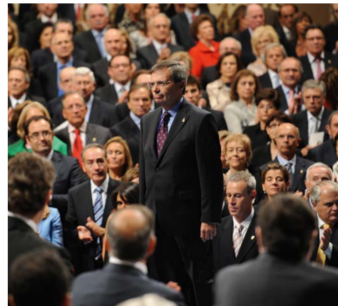
Ceremonia de entrega de los Principes de Asturias 2010

Sí. De todas formas, con los trasplantes no hubo ningún acuerdo nacional previo. Cuando empezó la ONT, los trasplantes eran un campo de batalla política como tantos otros. Lo que más ayuda a triunfar es el éxito, y el hecho de que nos pusieramos a la cabeza del mundo y que